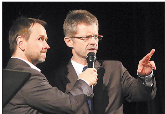
SENÁTOR Miloš Vystrčil (vpravo) měl při galavečeru na starosti předání cen nejlepšímu kolektivu ve čtenářské anketě Jihlavských listů.